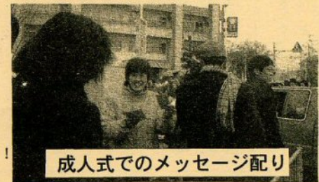
成人式でのメッセージ配り

市民の願いは、押しつけの合併ではなく、自分達の声が、届く安心の街づくりではないでしょうか？！