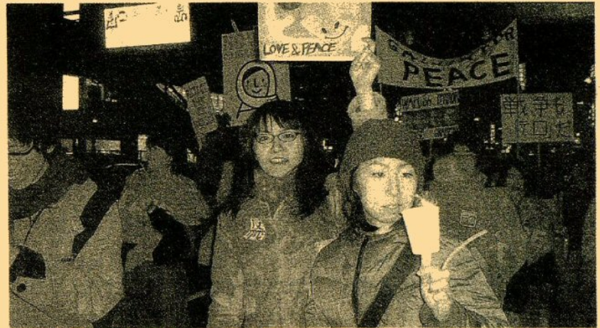
キャンドルを手にイラク攻撃反対とアピールする若者たち=15日夜、東京・渋谷駅前