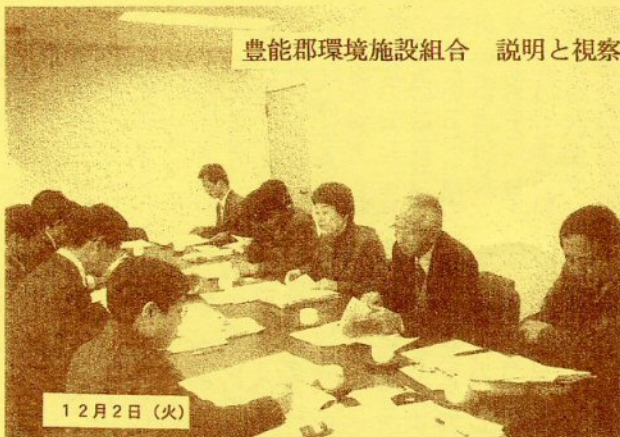
岩佐恵美参議院議員と1市3町の議員団と現地調査

説明会は、12月16日川西市文化会館 17日能勢町ふるさと会館（予定） 18日豊能町西公民館 19日猪名川町中央公民館 （いずれも午後7時から9時まで）