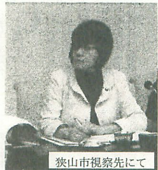
狭山市視察先にて