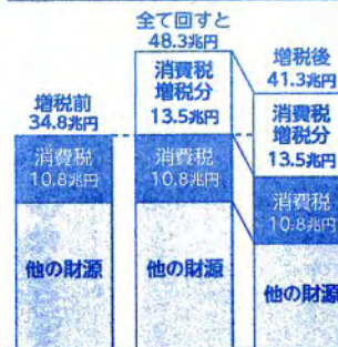
社会保障4経費(国・地方)2015年度