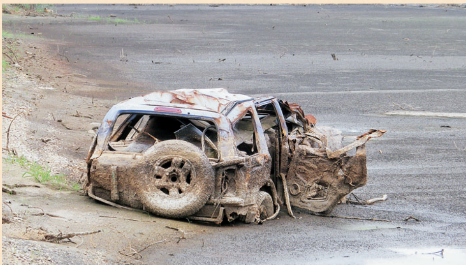
おだかく 南相馬市小高区：津波で打ち上げられ車と塩害の田んぼ