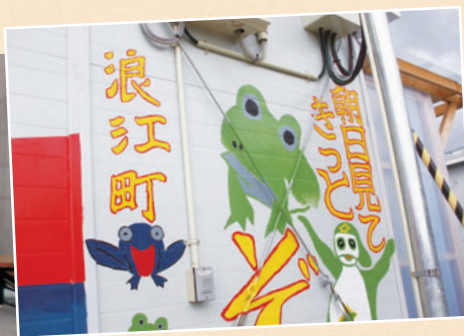
仮設住宅の壁に描かれた絵 (朝日見てきつと帰るぞ浪江町)