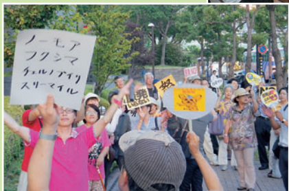
関西電力神戸支店 「金曜デモ」