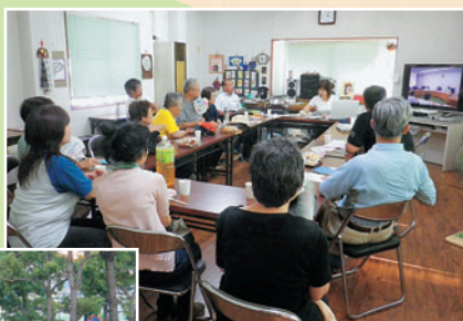
川西市内で 福島被災地の 視察報告会

7月11日～13日、議員団視察で福島市、南相馬市へ。 福島県は、死者2717人、行方不明者5人と多くの人が犠牲となり、未だ16万余の人々が避難生活を余儀なくされています。仮設に入居している浪江町のみなさんから「情報も入らない。いつ帰れるのかもわからない。先に希望がもてない。ただ生かされているだけ」と深刻な声…。 「なぜ、大飯原発を再稼働できるのか」「なぜ、復興の妨げになる消費税を増税できるのか」の叫びをしっかりと受け止め行動したいと改めて感じました。