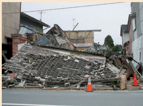
全壊した家屋がそのままの状態