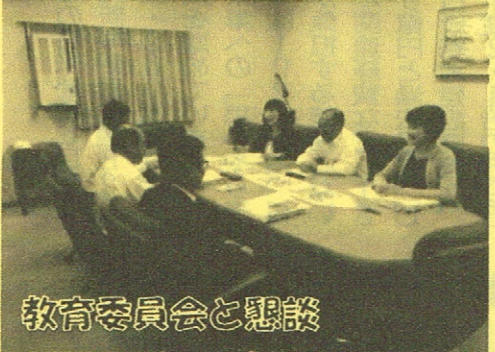
教育委員会と懇談

日本共産党議員団は4月26日、兵庫県・新温泉町の認定こども園の視察に行ってきました。町からは教育担当課や園長さん、常任委員会委員長さんまで参加していただき、大変勉強になりました。 新温泉町は人口15315人で、公設公営幼保連携型認定こども園が3か所、民設民営保育所型認定こども園が1か所あり、378人が入園中です。就学前児童は550人。 私達が視察させていただいた「ゆめっこ認定こども園(定員220人)」は、2014(平成26)年4月に開所し、子育て支援センター併設の施設です。建設費用は約6億円。 「こどもは社会の宝」との考えから町独自の上乘せ施策を実施し、充実ぶりに驚きました。まず、1歳児の保育士配置が3:1と国基準(6:1)の倍。保育所の保育料は国基準の6割程度(最高額36000円)、延長保育料なし。 生活時間などに差がつかないように、幼稚園型の子どもは毎日の給食と午後2時まで保育・教育をおこない1か月1万円。2時以降6時までの預かり保育は1回1000円。長期休みは、春休み6日間・夏休み5日間・お正月6日間。病気流行期の「学級閉鎖」はなし。 「波浪警報」以外は休園ですが、保護者の送迎があれば保育所型の子どもは受け入れ。3歳以上児はどの子ども通園バスの無料運行などされています。 低年齢児童数の増加によるなど「子ども・子育て計画」の定員見直しを来年度実施、2018(平成30)年度には海拔が低い園の建替え整備予定など町の実態に応じて柔軟に対応されています。 たくさんの資料を使って説明、保育士確保の困難さなどお話ししていただいて帰路につきました。