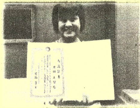
10月23日、当選証書を頂いて副議長室にて(任期は27日)