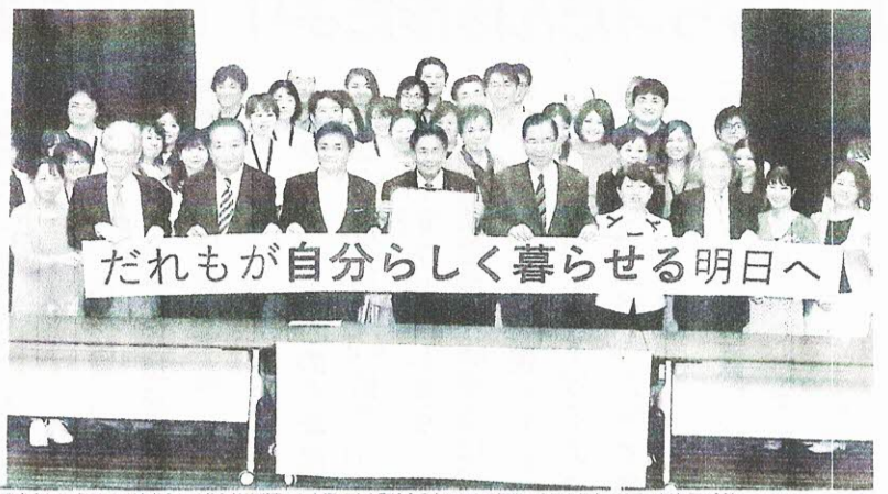
「だれもが自分らしく暮らせる明日へ」と掲げる市民連合の人たちと野党・会派の代表。20日、東京、赤坂の会派