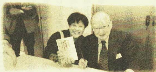
不破哲三さんと第28回党大会にて