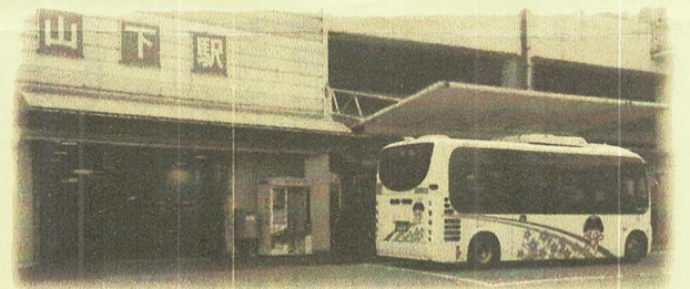
大和巡回～畦野～山下～病院～平野

今回の会議には、この間、様々な取組みで奮闘されている大和と緑台、陽明両コミュニティからオブザーバー参加されており、それぞれの地域の報告や思いが述べられました。しかし、影響を受ける東谷コミュニティの参加がなく、不思議な思いをしました。