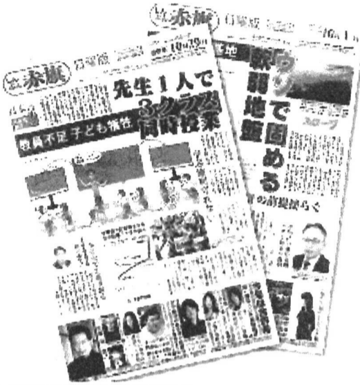
赤旗日曜版10月1日号(右)と10月29日合併号(左)

もう一つの表紙「ひと欄」(22面)には、棋士の藤井聡太八冠、俳優の稲垣吾郎さんなど、毎回話題の人物が登場。開きたくなる日曜版づくりに努力しています。 日曜版の「売り」のスク