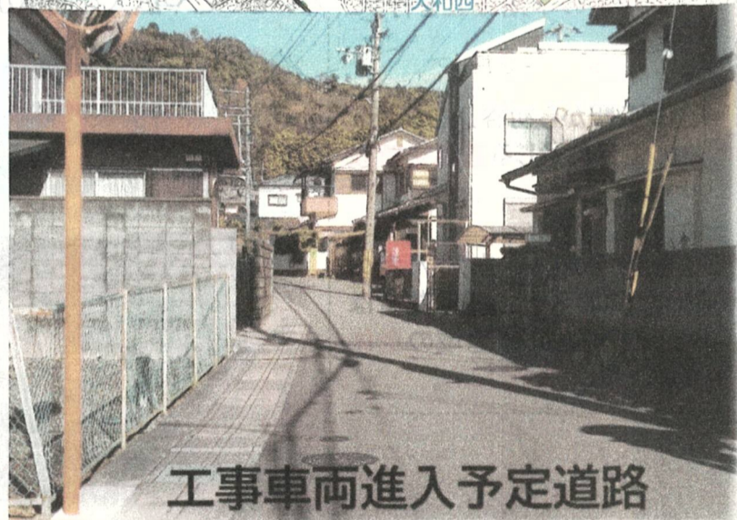
工事車両進入予定道路