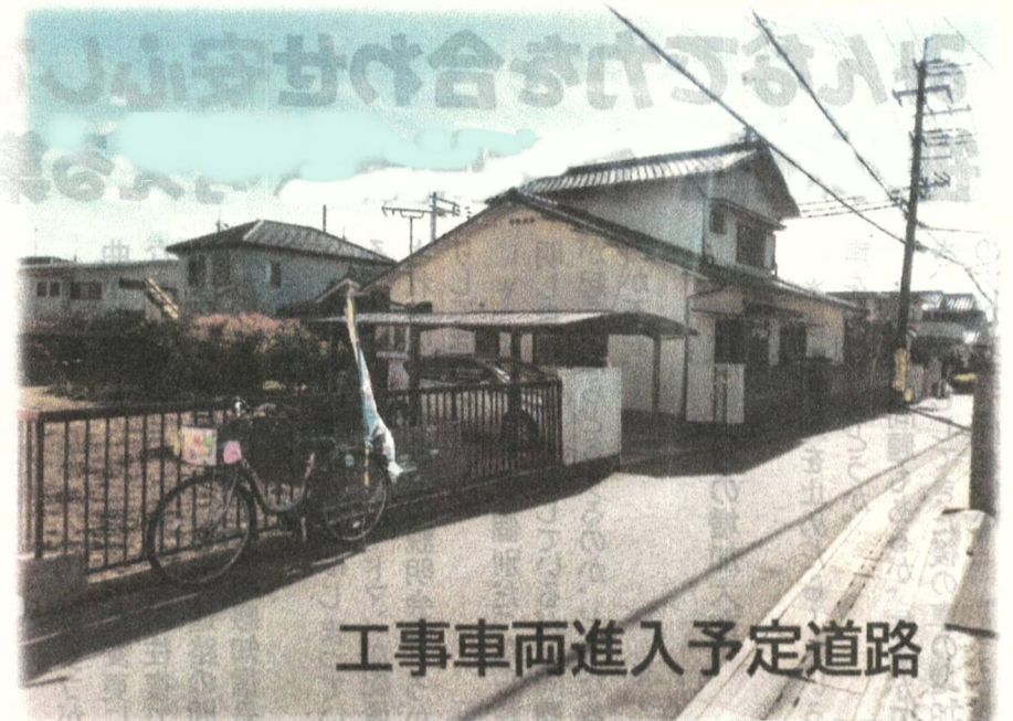
工事車両進入予定道路