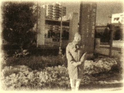
川崎市立多摩病院玄関前

指定管理者が医科大学などで、医師・看護師・医療技術スタッフの人材確保はスムーズだそうです。ただ、医師育成教育や実践を積んでいく手立てなどは、国の